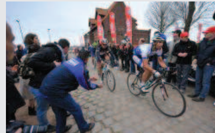
Sur les pavés du Paris-Roubaix, en attendant Tom Boonen (08/04/12)