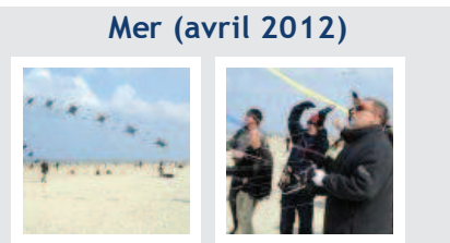
Mer (avril 2012)