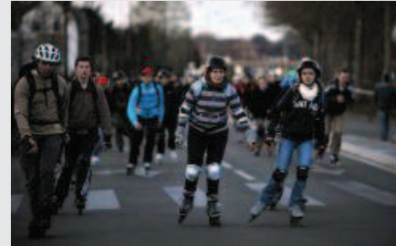
La Nocturne Lille Métropole confirme son succès (14/04/2012)